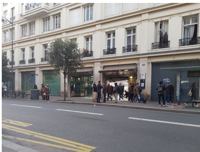
L'entrée de la gare du Nord depuis le Faubourg Saint-Denis est peu visible et peu lisible. Le trottoir est étroit. Ces dispositions ne sont pas à l'échelle de la gare.