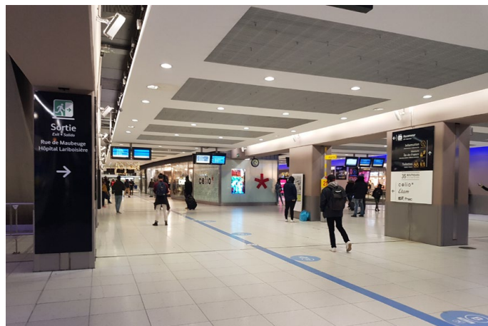
Les larges allées de la gare souterraine permettent de circuler facilement mais il n'existe pas d'espace d'attente digne de ce nom.

Le projet « Gare du Nord 2025 » devra à mon sens, répondre à ces trois enjeux pour que les usagers ressentent une amélioration significative dans leur quotidien. Des précisions dans le projet mériteraient d'être apportées sur certains points qui me semblent essentiels, « vus du quai ».