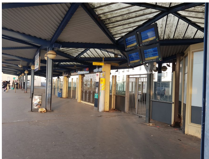
L'actuelle gare routière, architecturalement dépassée, peu visible et peu agréable.

Le réaménagement du parvis principal, point de contact entre la gare et l'espace public, est également à intégrer. Sur ce point, il faut prendre en compte la question de la sécurité. Les abords de la gare du Nord, sont particulièrement anxieux et le sentiment d'insécurité y est fort. Cela se traduit par la présence permanente de bandes ou de personnes errantes, parfois violentes. Cet espace n'incite pas à l'arrêt, ou la flânerie. Il est généralement traversé rapidement sans s'y attarder. La reconfiguration spatiale des abords devra nécessairement s'accompagner de moyens supplémentaires quant à la sécurité et à la prévention.